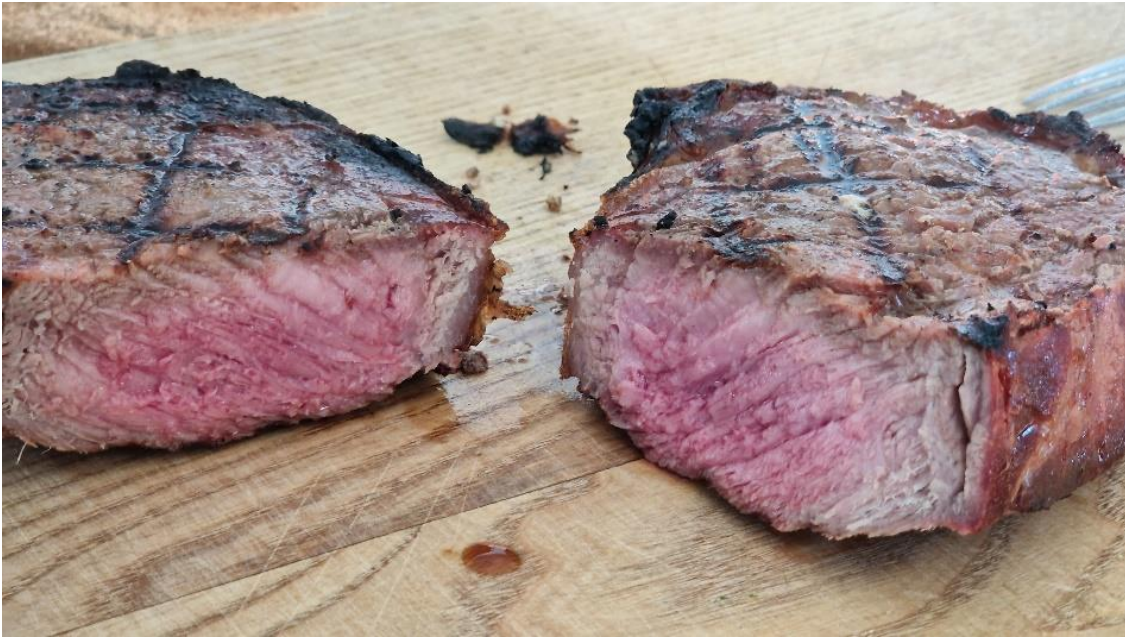
Qualitätsrindfleisch aus Österreich schmeckt