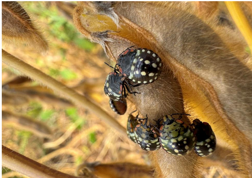
Bildtext: Die grüne Reiswanze bedroht im Ackerbau vor allem den Sojaanbau.

Bei der Grünen Reiswanze handelt es sich um einen Schädling, der 2015 erstmalig im Osten und Süden Österreichs nachgewiesen wurde und nicht zu unterschätzen ist. Mittlerweile sind mehrere Sichtungen in Oberösterreich gemeldet worden, vor allem im Linzer Zentralraum. Ihr Wirtspflanzenspektrum