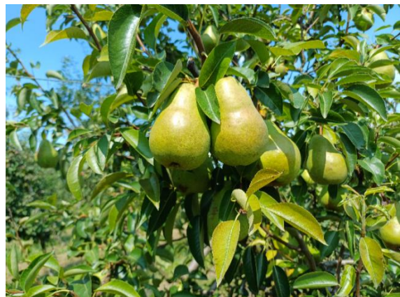
Bildtext: Der Anbau von Tafelbirnen hat in OÖ. in den letzten Jahren stark zugelegt.

58 Obstbaubetriebe bewirtschaften insgesamt 50 Hektar Tafelbirnen. In Oberösterreich wird eine Ernte von rund 2.000 Tonnen erwartet. Die Hälfte der Tafelbirnen wird in biologischer Wirtschaftsweise geführt. Tafelbirnen haben in den letzten Jahren relativ stark zugelegt.