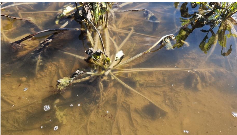
Bildtext: Nach der Dürre standen vor allem im Bezirk Perg mehrere Rübenfelder unter Wasser.

Auch in OÖ gab es durch die starken Niederschläge im September Totalschäden vor allem bei Grünland, Mais und Sojabohnen. Im Gegensatz zum Hochwasser von Anfang Juni traten diesmal die kleineren Flüsse und Zubringer zur Donau über die Ufer. Nachdem in diesem Gebiet schon ein großer Teil der Ernte eingebracht war, entstand bei den Herbstkulturen „nur“ ein Schaden in der Höhe von etwa einer Million Euro.