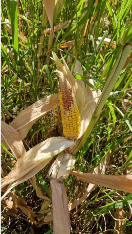
Bildtext: Dürreschäden bei Mais auf Schotterböden in Welser Heide.