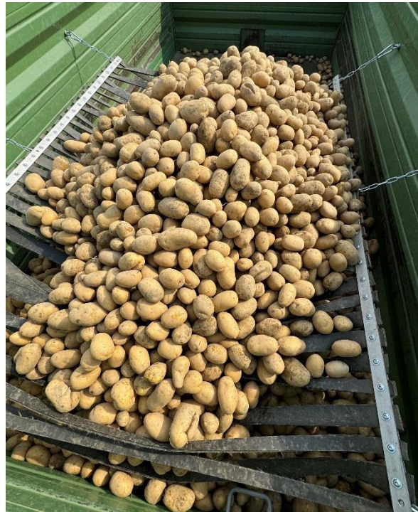
Bildtext: Die Erdäpfelpreise sind aufgrund des Hochwassers in Niederösterreich heuer schwer zu prognostizieren.

Den Speiseerdäpfelbauern wurde für heuer ein weiteres positives Wirtschaftsjahr nach 2023 prognostiziert. Die Anbauflächen stiegen trotz Engpässen beim Saatgut zu Beginn der Saison nennenswert an. Früherdäpfel konnten bis Mitte August zu ansprechenden Mengen und Preisen geerntet werden. Ab dann wirkten sich die Hitze und die September-Nässe auch bei dieser Kultur negativ aus. Zudem entstand durch sehr gute Ernten in Deutschland, Belgien, etc. ein Importdruck mit sinkenden Preisen. Inwieweit die durch das Hochwasser in vielen niederösterreichischen Anbaugebieten vernichtete Menge im Winterlager fehlen wird und die Preise dadurch wieder steigen werden, ist schwer vorauszusagen.