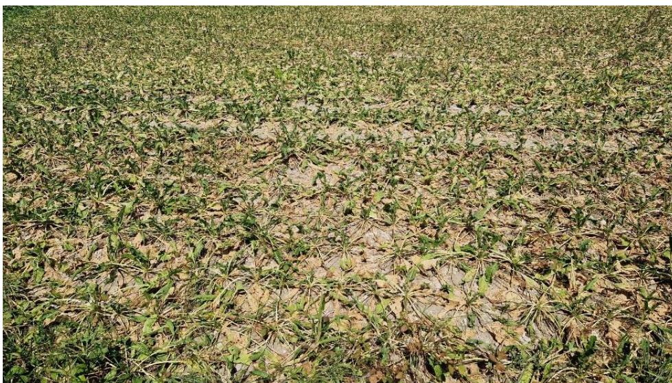
Bildtext: Viele Rübenfelder brachen in der Dürre regelrecht zusammen.

Oberösterreich war heuer witterungsmäßig von Juli bis Mitte September zweigeteilt. Während Hagelunwetter und starke Sturmböen insbesondere im Westen und Süden punktuell Totalschäden an allen Ackerkulturen und dem Grünland verursachten, machte sich im Juli und August im Norden und Osten die Dürre immer mehr bemerkbar. Insbesondere betroffen sind die Gebiete Eferding, Wels ostwärts und das Mühlviertel, wo es im Zeitraum von sechs Wochen Niederschlagsdefizite von bis weit über 90 Prozent gab. Dadurch kam es zu Schäden bei Grünland, Mais und Sojabohnen, nach ersten Erhebungen betragen diese bereits 25 Millionen Euro.