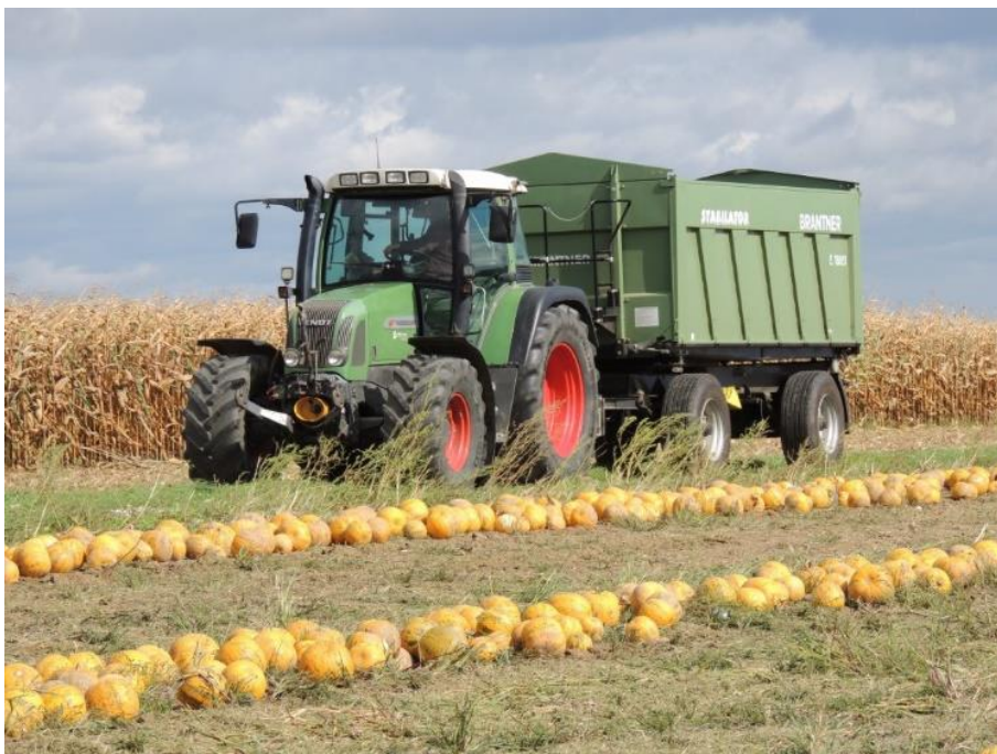
Bildtext: Die Ernte-Erträge schwankten heuer stark, denn das Wetter machte es den Ackerbauern nicht einfach. Positiv überraschte heuer der Ölkürbis.

„Wir müssen Maßnahmen treffen, um den Klimawandel und in Folge die an Häufigkeit und Intensität zunehmenden Wetterextreme zu bremsen. Zur Absicherung des Agrarstandortes gehören aber auch Maßnahmen, um den Bodenverbrauch zu bremsen. Andernfalls gefährden wir die Zukunft einer starken und regionalen Landwirtschaft und damit auch die heimische Lebensmittelversorgung“, ist Waldenberger überzeugt.