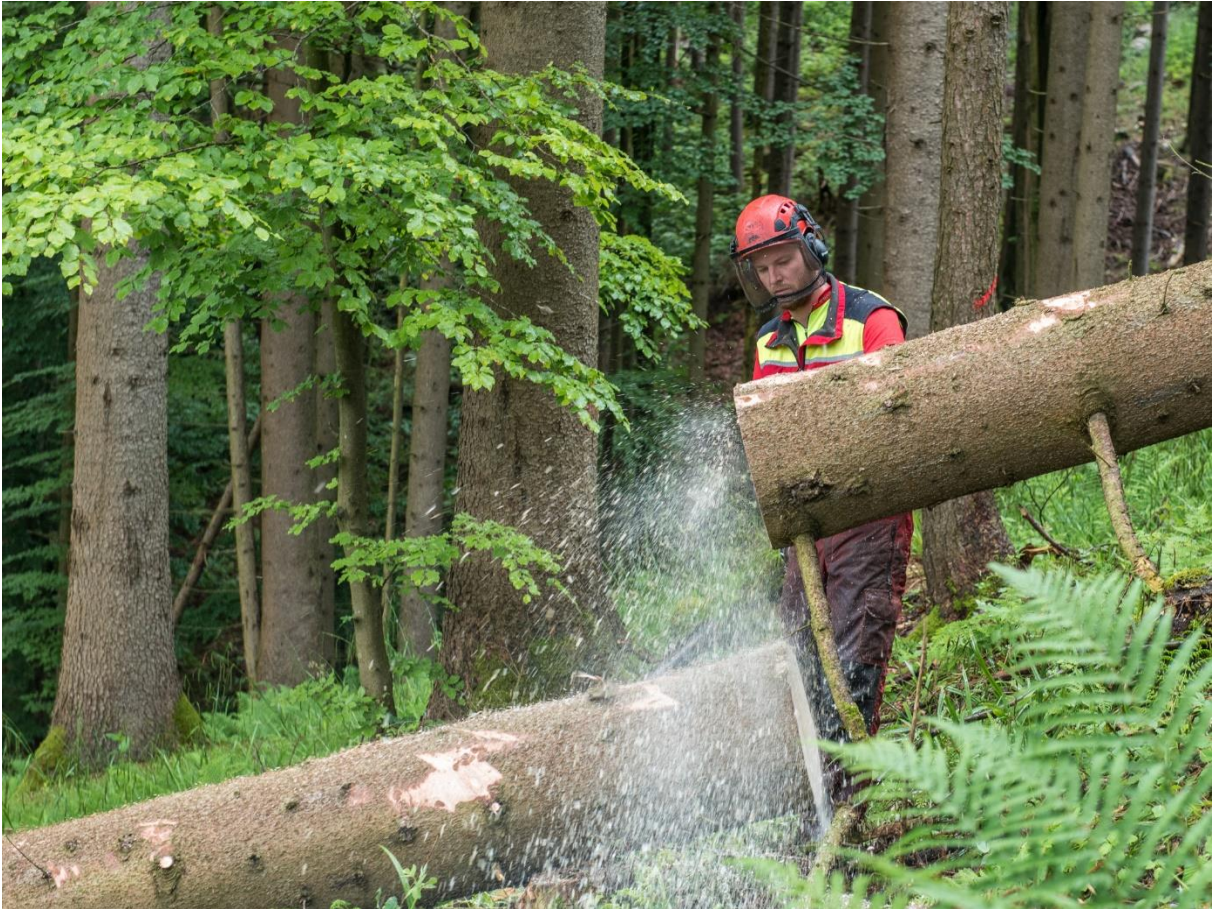
Bildtext: Zwar ist die Wirtschaftslage und damit die Nachfrage nach Holz heuer etwas gedämpft, die Branche erwartet aber für den Herbst und Winter wieder eine Marktbelebung.