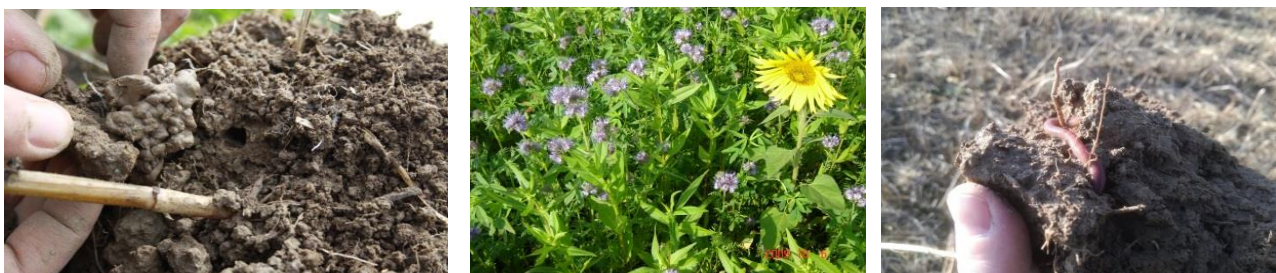
Abbildung 9: Bodenlebewesen, wie der Regenwurm, tragen entscheidend durch ihre Lockerungsaktivitäten und Ausscheidungen zur Humusbildung bei. Sie müssen über Ernterückstände, organische Dünger und Zwischenfrüchte ernährt werden.