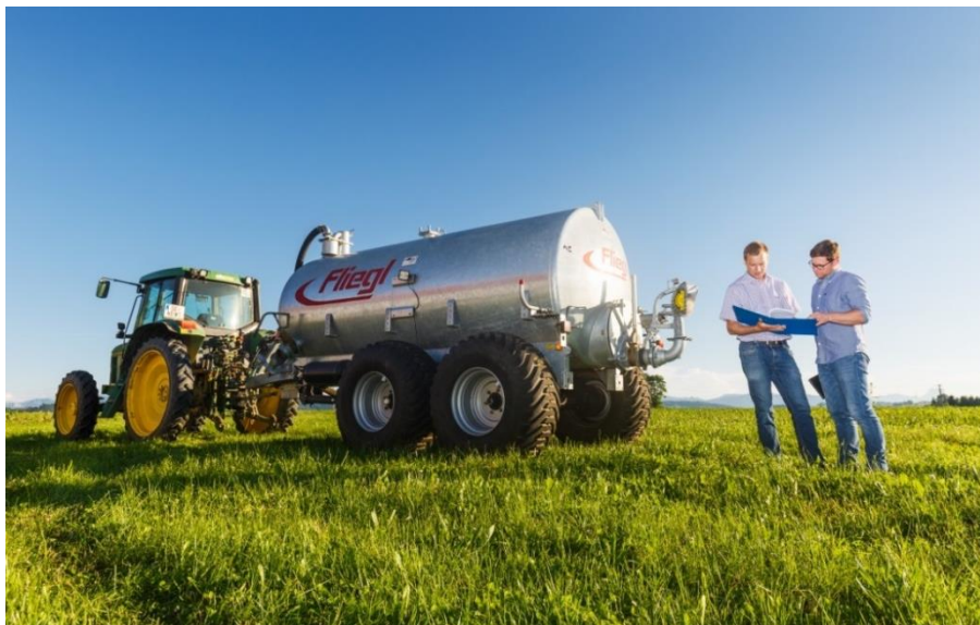
Abbildung 3: Eine bedarfsgerechte Düngung nach Bestandesentwicklung und Einbeziehung der Vorfrucht und Bodengegebenheiten spart Geld und beugt Nährstoffeinträgen in Oberflächen- und Grundwasser vor.