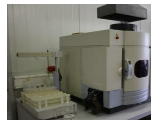
Abbildung 6: Für eine chemische Nährstoffanalyse ist eine Vielzahl an technischen Gerätschaften erforderlich. (Laborfotos CEWE Nußbach)