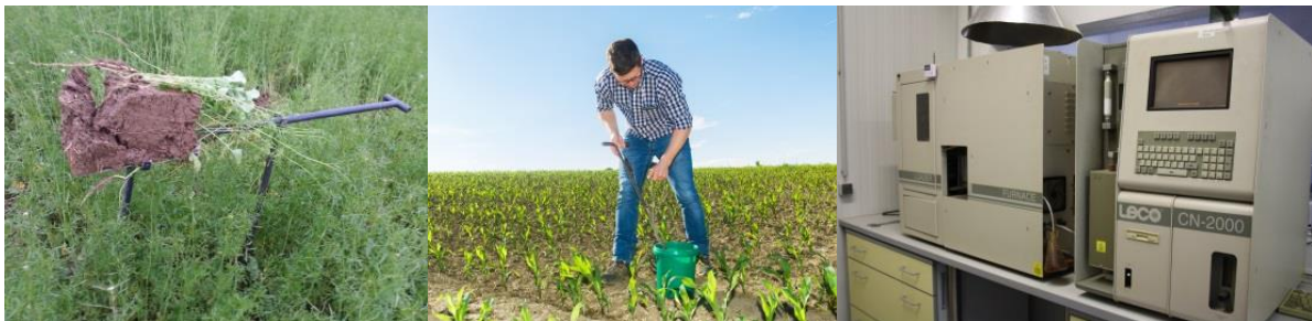
Abbildung 2: Bodenuntersuchungen können direkt am Feld oder mittels Laboranalyse durchgeführt werden.