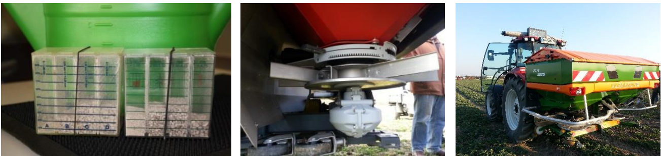
Abbildung 10: Nicht nur die Stickstoffmenge, sondern auch die Querverteilung am Feld ist wichtig, um die Pflanzenversorgung sicherzustellen und eine flächendeckende Ausnutzung des Düngepotenzials zu gewährleisten.