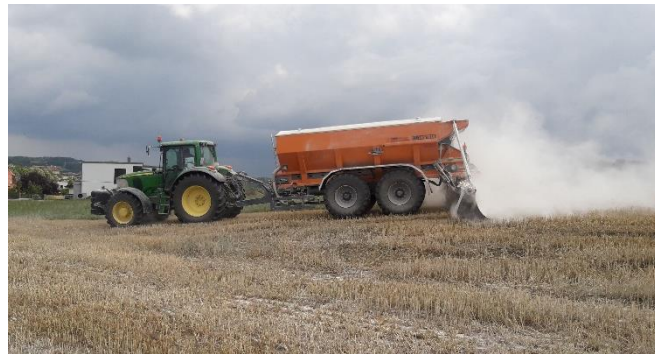
Abbildung 7: Kalk bringt´s!

Auf leichten Böden sind Mengen über 1,5 t CaO pro Hektar, auf mittelschweren und schweren Böden Mengen über 2 t CaO pro Hektar auf mehrere Gaben jeweils im Abstand von zwei Jahren aufzuteilen. Auf schweren, verdichteten Böden haben Branntkalk und Mischkalk eine günstigere und raschere Wirkung als die übrigen Kalkformen. Durch sehr hohe Gehalte an Magnesium kann es zu erhöhten pH-Werten kommen, trotz Mangel an Calcium. Bei derartigen Standorten sollten die austauschbaren Kationen und die Kationen-Austauschkapazität (KAK) untersucht werden. Der Kalkbedarf ist auch immer in Verbindung mit Magnesium (Mg) zu sehen.