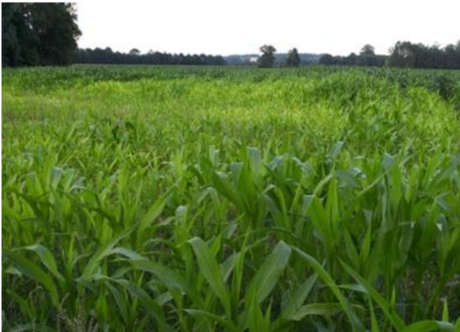
Abbildung 14: Für eine optimale Bestandsentwicklung müssen die benötigten Nährstoffe in ausreichender Form verfügbar sein und die Bodenstruktur darf keine Schwächen vorweisen.

Eine Bodenuntersuchung liefert vielfältige und wertvolle Informationen zum gegenwärtigen Zustand eines Bodens. Auch die Produktivität und die Bodenfruchtbarkeit können durch richtige Interpretation der Ergebnisse abgeleitet werden. Dabei gilt es steht's den Kontext zum jeweiligen Standort herzustellen. Durch Wiederholung der Beprobung alle 4-6 Jahre können Veränderungen im Boden festgestellt werden um letztendlich die richtigen Maßnahmen zur Steigerung der Bodenfruchtbarkeit umzusetzen. Dabei sollte man sich Ziele formulieren und Prioritäten definieren um gezielte Maßnahmen Schritt für Schritt umzusetzen.