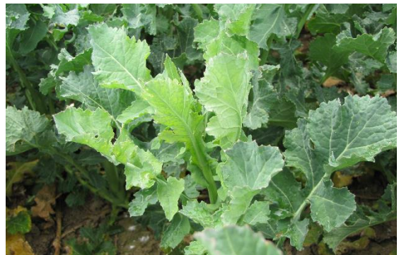
Abbildung 13: Schwefelmangel bei Raps – aufhellen jüngerer Blätter

Schwefel kann in der Pflanze nicht umgelagert werden. Bei einer ausreichenden Versorgung bzw. Überversorgung in älteren Pflanzenteilen kann es zu Schwefelmangel an jungen Teilen kommen (siehe Abb. 13).