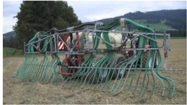
Abbildung 11: Eine bodennahe Ausbringtechnik flüssiger Wirtschaftsdünger reduziert Emissionen und bringt verbesserte Nährstoffeffizienz!

Bei Trockenheit – besonders im Frühjahr – kann die P-Verfügbarkeit vermindert sein. Ein optimaler Luft- und Wasserhaushalt (gute Struktur, Durchwurzelung, Krümel) verbessert die Verfügbarkeit des Phosphors. Ebenso begünstigen höhere Bodentemperaturen und pH-Werte im Bereich zwischen 6 und 7 die Verfügbarkeit des Phosphors.