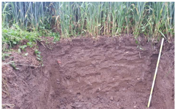
Abbildung 12: Bodenprofil – ein Blick in den Boden lohnt sich allemal!

Bestimmte tonhaltige Böden können Kalium in den Zwischenschichten einlagern, somit der Pflanzenwurzel das Kalium versperren. Auf derartigen Böden sollte die Kaliumdüngung in Teilgaben, ähnlich der Stickstoffdüngung, durchgeführt werden, um so immer wieder „frisches“ Kalium zuzuführen.