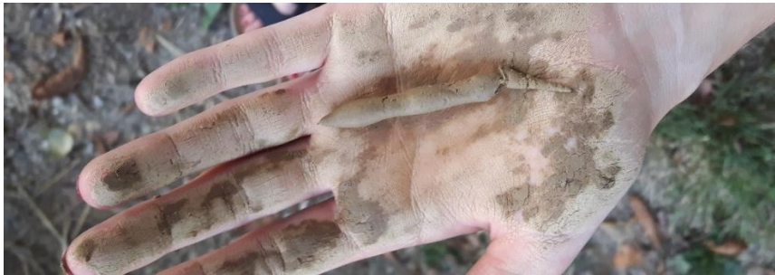
Abbildung 5: Durchführung der Fingerprobe