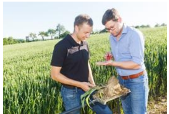
Abbildung 4: Durch die Spatenprobe können Strukturprobleme und Verdichtungen festgestellt werden.

Neben dem Spaten können mit einer Bodensonde etwaige Bodenverdichtungen festgestellt werden. Diese können nach der Ernte bei trockener Witterung mit einem entsprechenden Bodenbearbeitungsschritt aufgelockert werden.