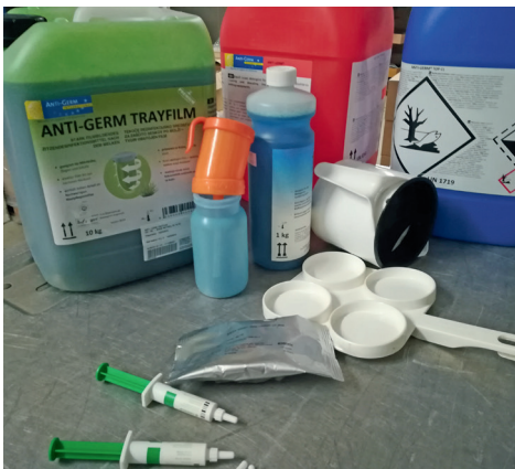
Foto 1: Hemmstoffe (Medikamente, Reinigungsmittel, Fliegenbekämpfungsmittel).

Solche Substanzen können bei der Weiterverarbeitung der Milch in der Molkerei große Schwierigkeiten verursachen. Ebenso können sie auch ein Risiko für die Gesundheit der Konsumenten darstellen. Ihr Eintrag in die Milch muss daher unbedingt vermieden werden.