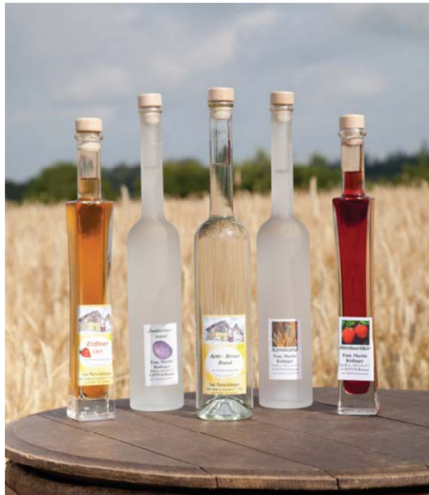
Bild 1: Zur Herstellung von Alkohol unter Abfindung werden selbstgewonnene alkoholbildende Stoffe auf einem zugelassenen einfachen Brenngerät verarbeitet.

Wird eine zur Herstellung von Alkohol verwendete Vorrichtung erworben oder veräußert (z.B. Übergabe/Übernahme bzw. Verkauf/Kauf eines land- und forstwirtschaftlichen Betriebes), muss dies dem zuständigen Zollamt innerhalb einer Woche (gerechnet vom Eintritt des anzuzeigenden Ereignisses) schriftlich angezeigt werden. Die Anzeige kann formlos oder unter Verwendung eines Formblattes erfolgen. Von der Meldepflicht ausgenommen sind Brenngeräte bis 2 Liter, die nicht zur Alkoholherstellung verwendet werden (z.B. zu Ausstellungszwecken).